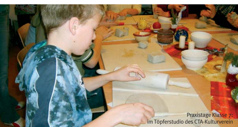
Praxistage Klasse 7: im Töpferstudio des CTA-Kulturvereins