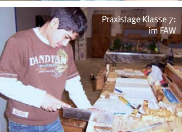
Praxistage Klasse 7: im FAW