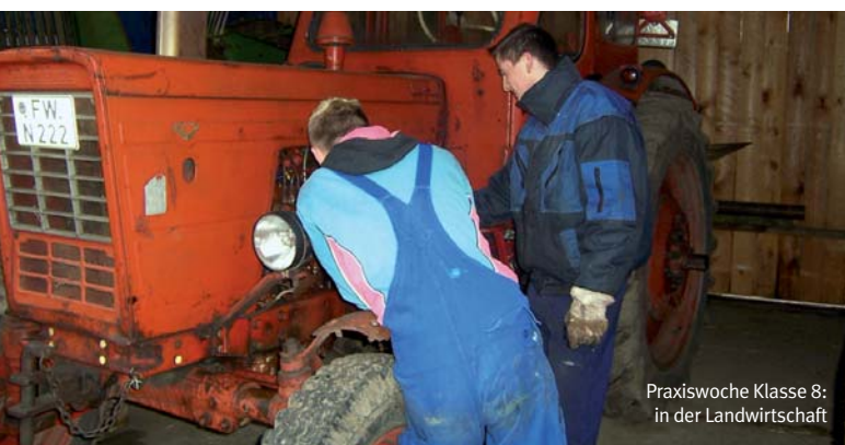
Praxiswoche Klasse 8: in der Landwirtschaft