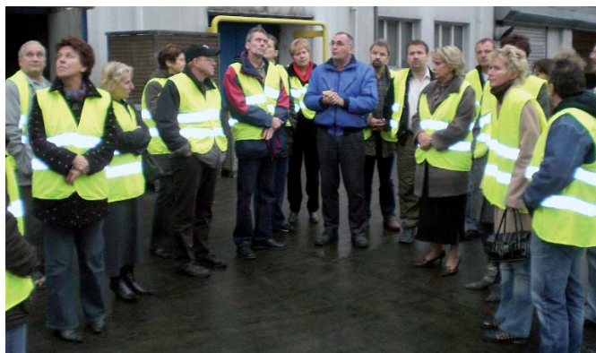
Lehrerfortbildung Reifenwerk 05.12.07: Die zweite Lehrerfortbildung des Arbeitskreises Schule-Wirtschaft fand mit großer Begeisterung der über 20 Teilnehmer im Reifenwerk bei Goodyear Dunlop Tires in Fürstenwalde statt.