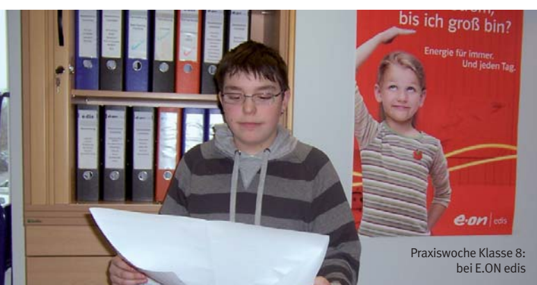
Praxiswoche Klasse 8: bei E.ON edis