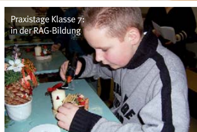
Praxistage Klasse 7: in der RAG-Bildung