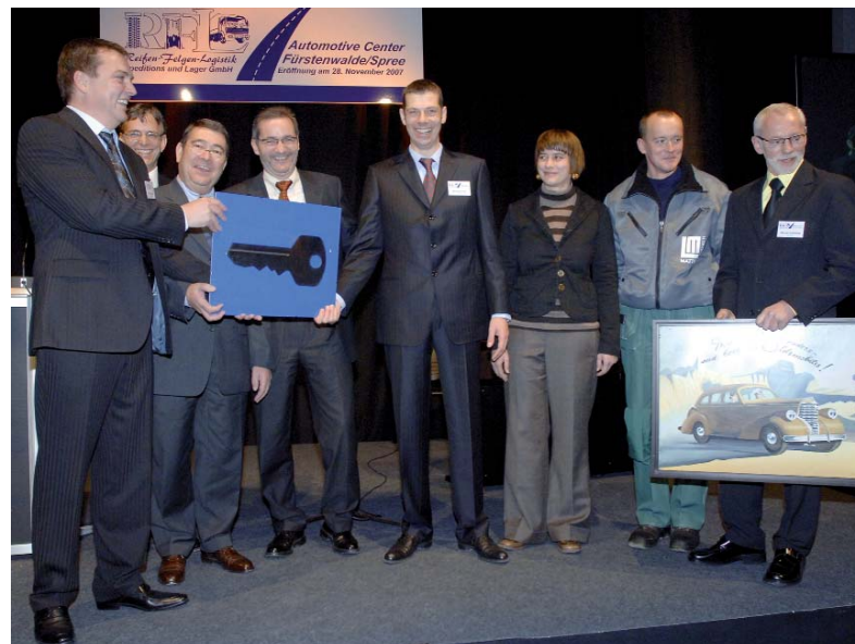
Eröffnung des RFL Automotive Center Fürstenwalde am 28. November 2007