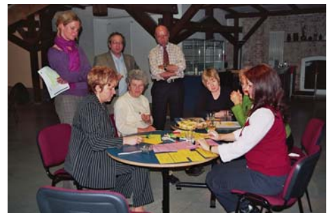
Ideen bündeln – Netzwerke knüpfen Aufaktveranstaltung am 23. März 2006

Alte können von Jungen lernen und junge Menschen profitieren von Ruhe, Gelassenheit und Zeit der Älteren, z.B. im Rahmen der Computerkurse für Senioren an der Rahnschule, beim Großelternleihservice oder bei gemeinsamen Projekten von Jugendclub Nord und Seniorenbeirat und dem Verein Positiv und dem Südclub. Mit dabei sind auch der Bund der Ruheständler und Hinterbliebenen, die Lokale Agenda 21 und engagierte BürgerInnen. Angestrebt wird ein Projekt zum generationsübergreifenden Wohnen.