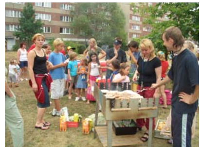
Familien treffen sich im Stadtteil beim Spielplatzgeburtstag im Innenhof der Komarowstraße am 8.Juli 2006

Ziel dieser AG ist es, generationsübergreifende Dienstleistungs- und Betreuungsangebote in der Stadt zu bündeln und zu ergänzen. Die Wanderausstellung „spielen, lesen, gesund aufwachsen in der Familie“ wird in die Stadt kommen. Ein Mehrgenerationenhaus soll entstehen.